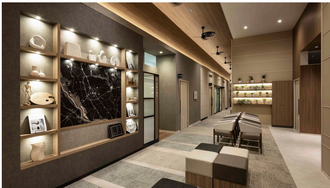
プロムナードの待合エリアに浦和周辺の地図をグラフィカルに表現したコミュニケーションボード

乃村工藝社は企画・建築コンサルティング、デザイン・設計、制作・施工を担当しました