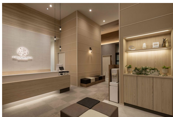
清潔感と温かみを感じさせる一般外来受付

乃村工藝社は、移転準備のための建築/設備コンサルティング、リブランディング業務・VI開発、設計デザイン・施工業務を担当しました。